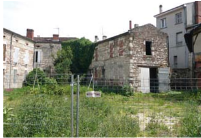
L'îlot Delbourg Barbusse avant la réalisation des travaux entrepris par CILIOPEE Habitat.

Les bâtiments qui présentaient un attrait architectural ont été conservés, d'autres ont été rasés afin de construire « Les Terrasses de Delbourg » : 12 logements