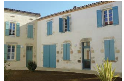
▲ Les Terrasses de Delbourg : 12 appartements et la 5 ème maison relais de CILIOPEE.

Ilôt insalubre auparavant, les Terrasses de Delbourg ont réussi à re-créeer un "esprit village" avec cette cour intérieure très agréable pour les habitants.